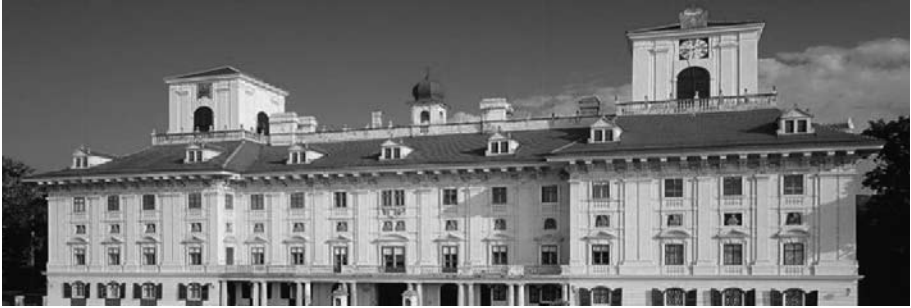
Schloss Esterhazy, Eisenstadt