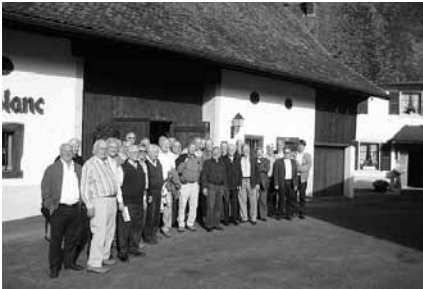
DIE HERBSTFAHRER VOR DEM CHEVAL BLANC IN ASUEL

Fisch im feinen Blätterteig. Das Perlhuhn. Brie de Maux und ein überraschender Dessertturm. Dass mit der Cloche serviert wird überrascht eigentlich nicht. Dieses Haus ist weiterzuempfehlen.