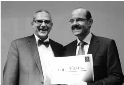
Scheckübergabe der Begünstigten