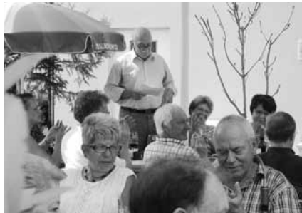
Das Wort hat der Präsident

Natürlich liess es sich unser Präsident nicht nehmen, den vielen aktuellen und früheren Vortandsmitgliedern und Helfern, Ex-Präsidenten, Reveille-Chor Obmännern usw. für Ihre Mitarbeit im Vorstand und deren Partnerinnen für ihr Verständnis dafür danken, den neuen Dirigenten in unserer Mitte auch gesellschaftlich bei uns gebührend aufzunehmen und, wen wundert's, den Vorstand auf die Singtaug-