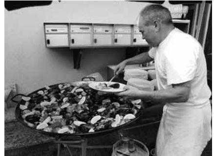
Paella – so lecker wie schön!

renausflug nach Liestal unternimmt, um im Engelsaale dem Prinzen Karneval einen festlichen Empfang zu bereiten. So geschah es auch am Sonntagnachmittag. Im originell, militärisch-schweizerisch geschmückten Saale fanden sich die Liedertäfler zahlreich ein. Geboten wurde ein fasnächtliches Programm mit „Stiggli“, Trommel- und Pfeiffer-Vorträgen. Auf dem Weg zum Bahnhof zur Heimfahrt nach Basel wurde dann noch der Fackelzug der Liestaler Jugend durch die Rathausstrasse, angeführt von der Stadtmusik, bewundert, ebenso das Höhenfeuer“