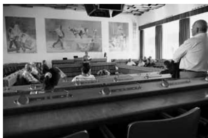
Hier wird regiert

„Es ist seit Jahren Tradition geworden, dass die Basler Liedertafel ihren Fastnachts-Her-