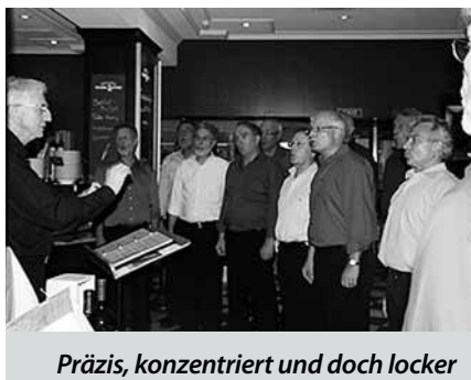
Präzis, konzentriert und doch locker