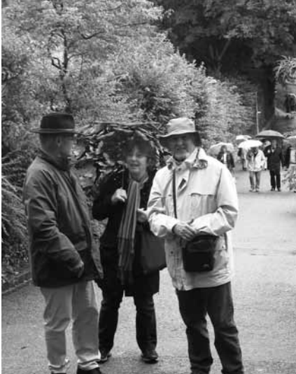
SCHIRMER WAREN NUR KURZ GEFRAGT

Wenn Engel reisen, lacht der Himmel. In letzter Zeit traditionsgemäss eher Freudentränen und so war es auch in diesem Jahr, was ja eigentlich die Situation unseres Vereins gar nicht so schlecht wiedergibt. :-).